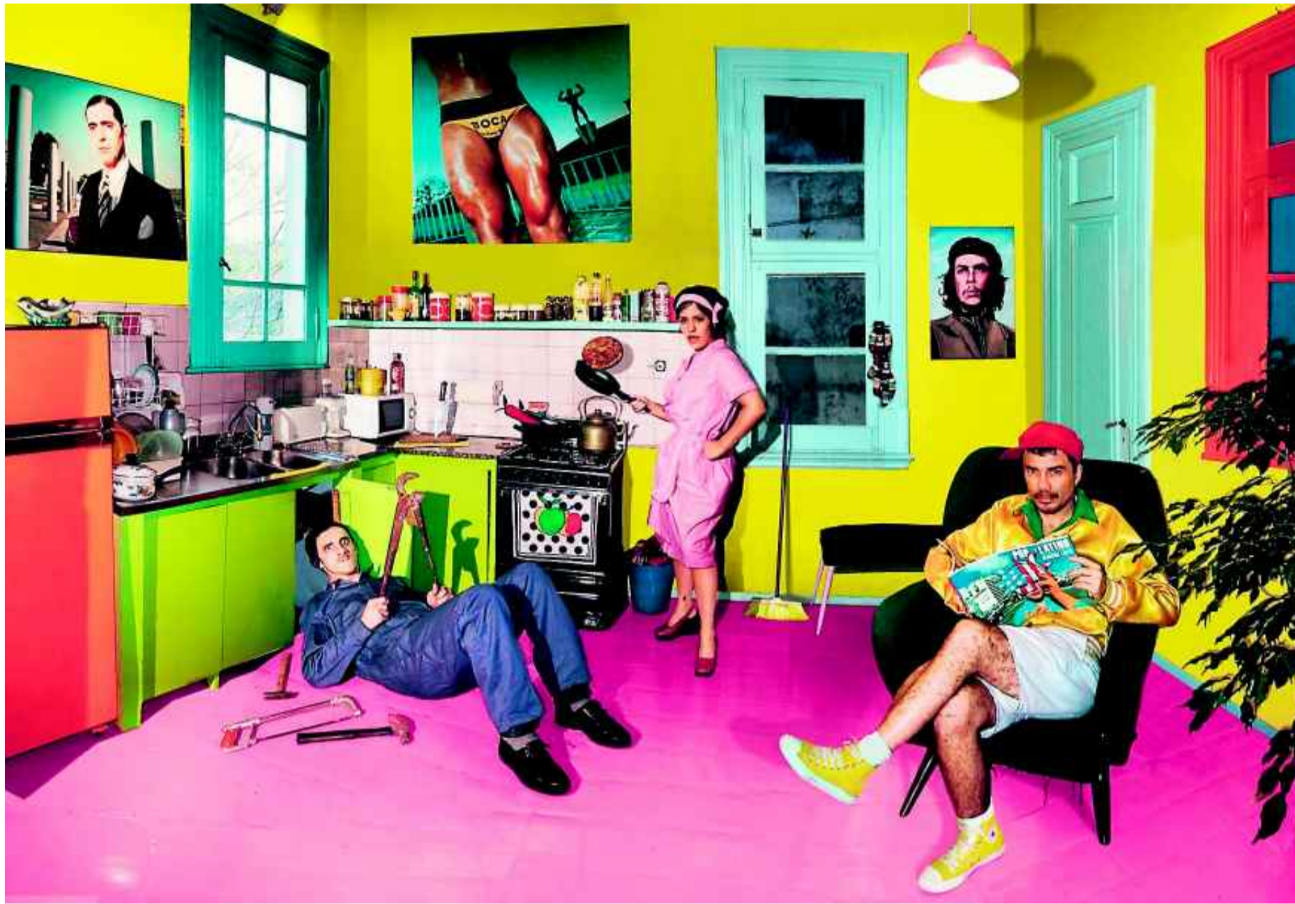
In grellen Farben karikiert Marcos López in seinem „Autorretrato En La Cocina“ (Selbstporträt in der Küche) die argentinische Folklore.